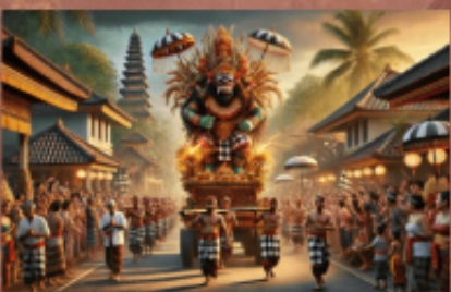
Nyepi & Ogoh Ogoh