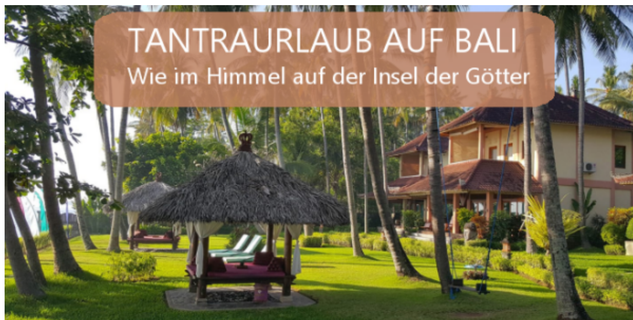
Tantraurlaub auf Bali - "Wie im Himmel auf der Insel der Götter"

13. - 20. März 2026 im Holiway Garden Resort im Norden von Bali - der "Insel der Götter" - mit anschließender Verlängerungswoche (mit Angela Mecking und Ralf Lieder)