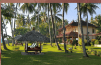
Balines. Wohnen & Essen