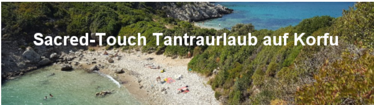
Sacred Touch Tantraurlaub auf Korfu

Vom 20.-27.6.2026 im Ouranos Club in Arillas/Korfu